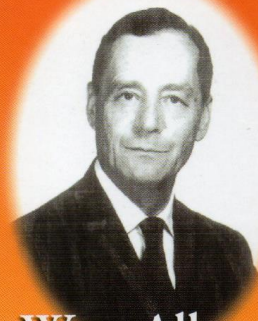
Wass Albert (1908–1998)

Romlandó kincsekért ne törje magát senki. Igyekeztek helyettök jobb kincseket szerezni.