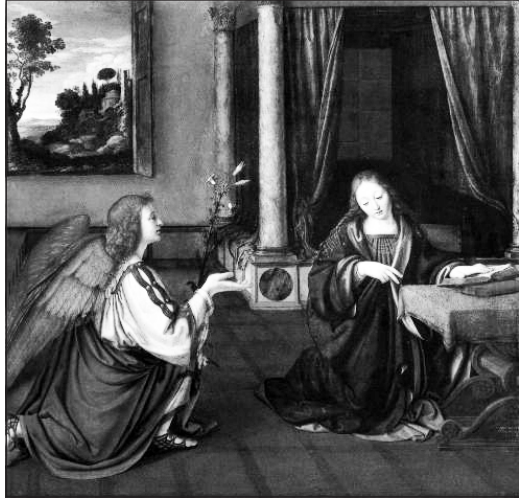
„Íme az Úr szolgálóleánya”

Az evangéliumban Szent Lukács evangélista Gábor főangyal názáreti látogatásával és Mária alázatos igen-