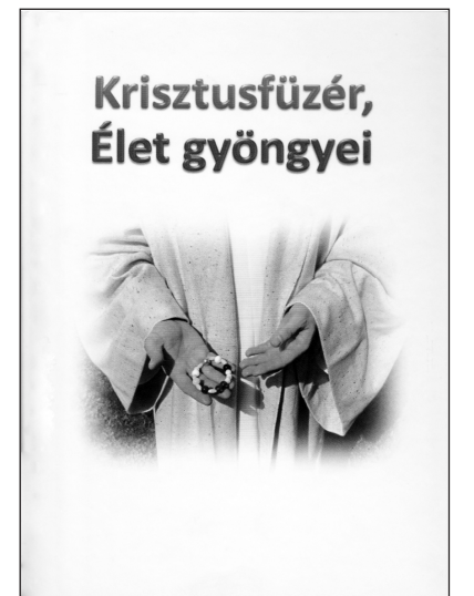
Út lelkünk mélyéhez és Isten országához