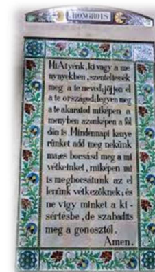
a Miatyánk-templom Jeruzsálemben tábla magyar nyelven is